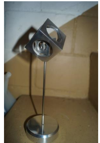
Cube in a Cube